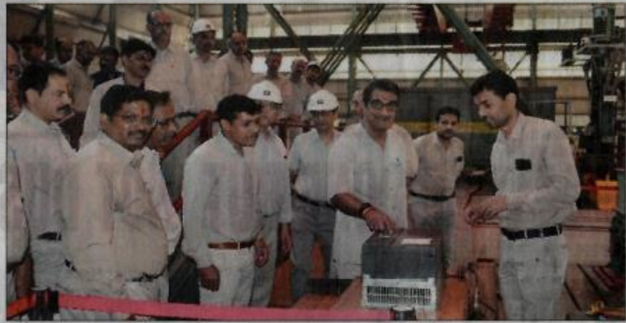
BHEL recently inaugurated the newly-constructed testing platform for combined system testing for test set-up of Vande Bharat train sets at the Center for Electric Transportation (CET).

Reportedly, BHEL has recently received an order for 80 Vande Bharat coaches and propulsion systems from the Indian Railways. It has been decided to do the Combined System Testing, in the CET lab. Creating Vande Bharat Combined System Testing in place of MCF test set-up was a very challenging task in itself. But on demand from customer and site, additional set-up for